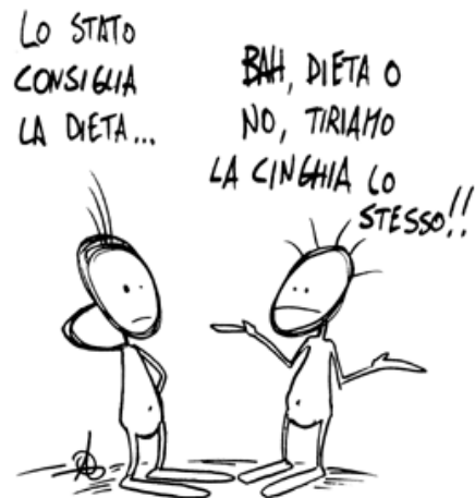
© 2004 Andrea Bocchi www.andreabocchi.com 23.09.04